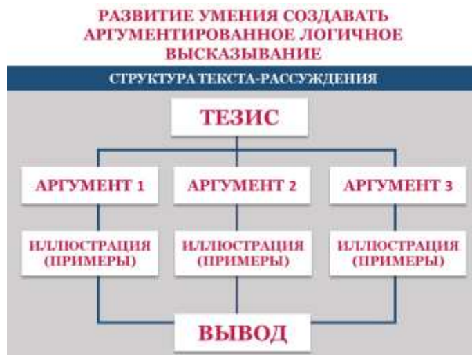
Рис. 1. Логическая структура сочинения-рассуждения (ФИПИ)

Также для создания плана итогового сочинения целесообразно использовать стратегию «Фишбоун» (диаграмму Исикавы).